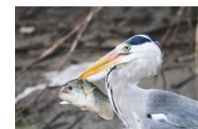
ブルーギルを捕まえたアオサギ